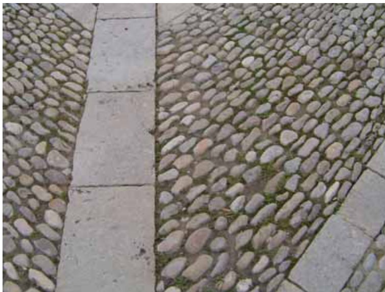
Fig. 8. Empedrados

A finales del siglo XVIII se inicia una nueva visión tecnológica de los pavimentos urbanos por razones de higiene, mejora del transporte, etc. La tipología de los pavimentos de piedra en las ciudades españolas es muy variada.