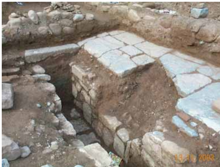
Fig. 5. Cabecera de cloaca

Tanto las aguas sobrantes de las fuentes públicas como las de lluvia las canalizaban hasta las cloacas contribuyendo así a la salubridad pública. ( Figs. 5 y 6 )