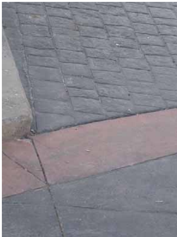
Fig. 23. Pavimento de hormigón impreso