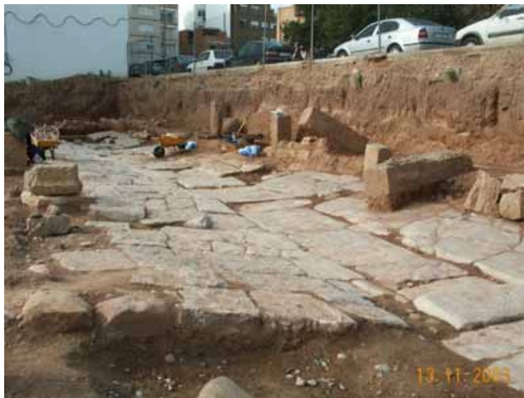
Fig. 2. Calle romana en Sagunto (Valencia)

Las vías urbanas de más categoría, se construían con un gran firme. En primer lugar se efectuaba una excavación de tierras hasta encontrar una capa dura de cimentación, sobre la que se preparaba un lecho formado por arcillas y bolos o gravas de gran tamaño ( statumen ); sobre esta capa se extendía otra de hormigón de cal ( rudus ) y en otros casos piedra machacada con materiales sueltos de grano fino ( nucleus ), para sobre ésta, colocar como pavimento losas o lajas de piedra ( summa crusta ) colocadas con el máximo cuidado formando un extraordinario pavimento continuo, donde las juntas se cuidaban mucho.