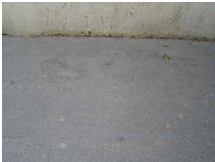
Fig. 21. Pavimento de asfalto fundido