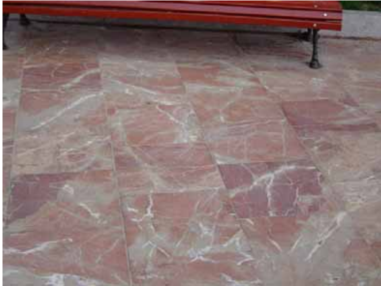
Fig. 24. Pavimento de piedra