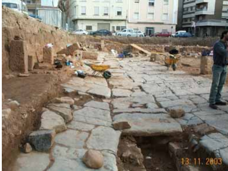
Fig. 6. Cloaca central

Las cloacas de sección rectangular, generalmente situadas en el eje de la calle, disponían de losas de cierre en la coronación con juntas a tope dejando un hueco entre una y otra a una distancia determinada para absorber el agua de lluvia.