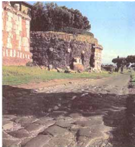
Fig. 4. Vía Apia (Roma-Capua). Primer camino empedrado. Año 312 a. de C.

En otros casos, estas vías urbanas estaban formadas por dos bandas longitudinales de piedra y varias transversales para contener el empedrado concertado de los huecos centrales (Fig. 4).