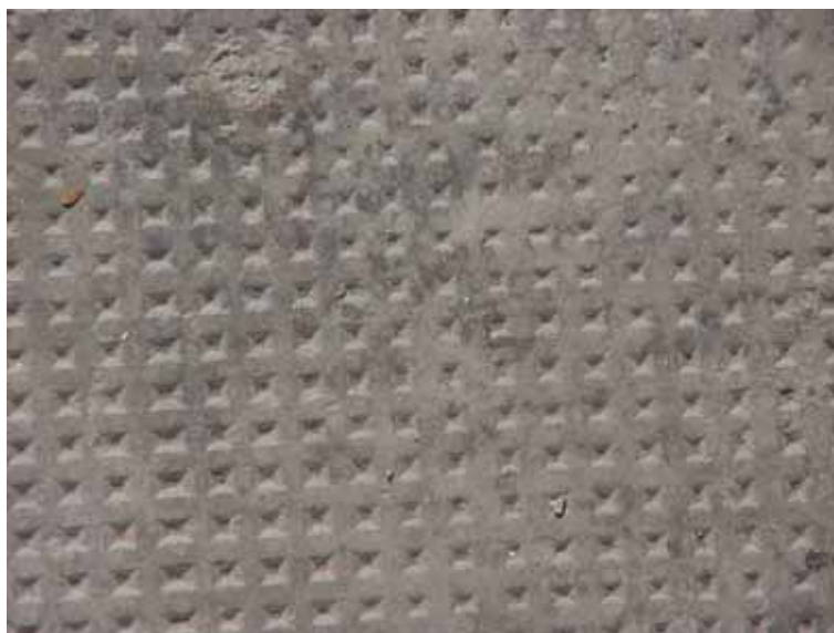
Fig. 19. Pavimento hormigón ruleteado

En cuanto a los pavimentos empleados para vías peatonales con condicionantes distintos a los empleados en calzadas, podemos citar los siguientes: ( Figs. 19, 20, 21, 22, 23 y 24 ).