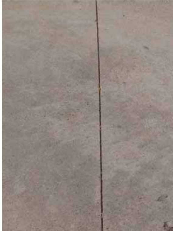
Fig. 20. Pavimento de hormigón