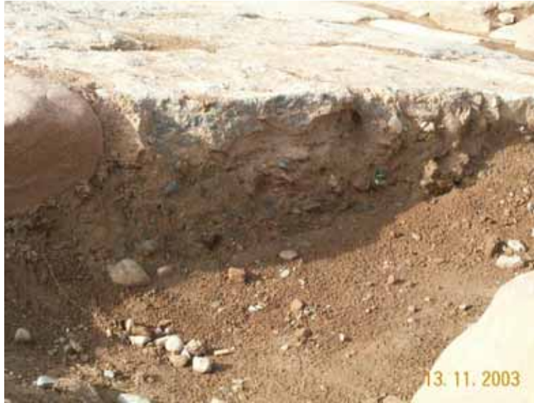
Fig. 3. Detalle del firme

En otros casos, estas vías urbanas estaban formadas por dos bandas longitudinales de piedra y varias transversales para contener el empedrado concertado de los huecos centrales (Fig. 4).