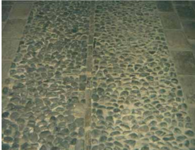
Fig. 7. Empedrados

En la Edad Media aunque en menos escala es frecuente la pavimentación con losas de piedra más o menos concertadas y también el empleo de piedras de tamaño más reducido como pavimento ( empedrados ) para el tránsito de caballerías y ganados ( Fig. 7 y Fig. 8 ).