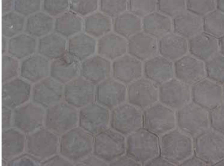
Fig. 22. Pavimento de loseta hidráulica